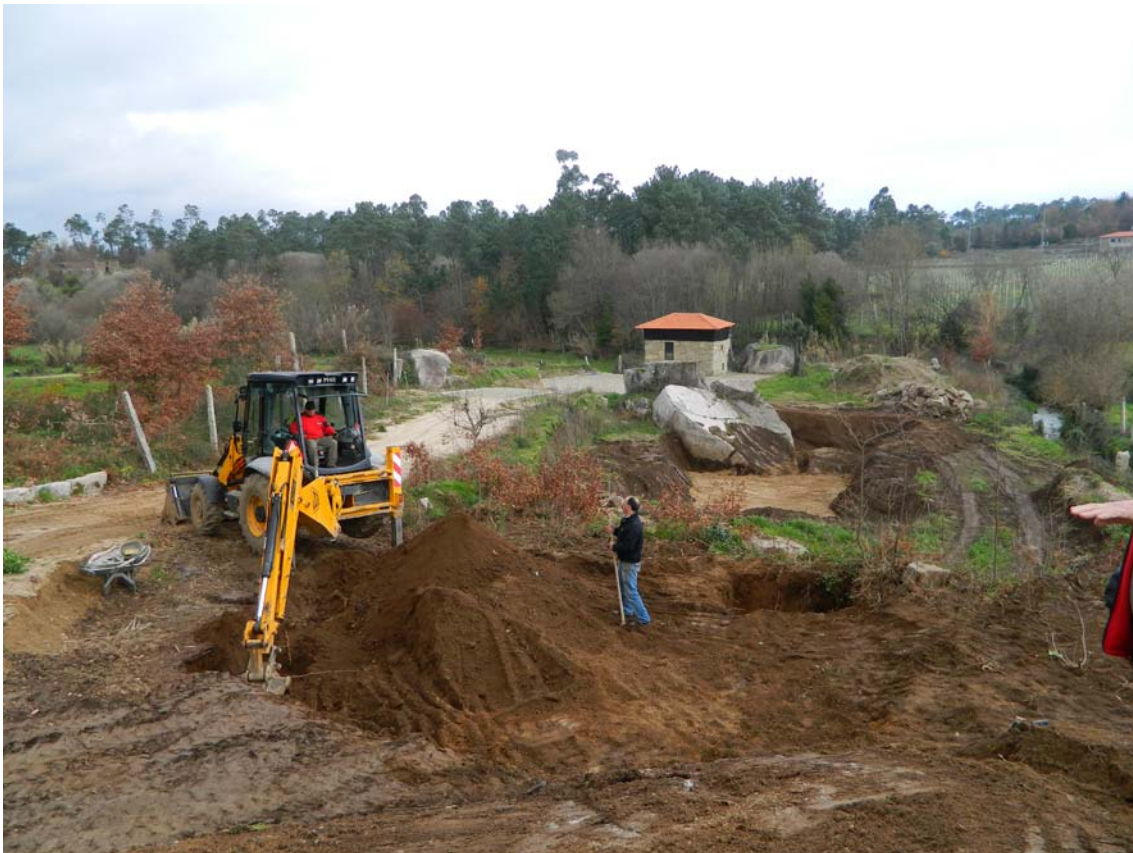
30-01-2013 Evolução da implantação planimétrica do Alojamento Lago

Continuação da formalização e naturalização do lago. Projeção altimétrica do alojamento lago e início de trabalhos associados às fundações do mesmo. Finalização do processo regenerativo da infiltração existente no Moinho Negroiro.