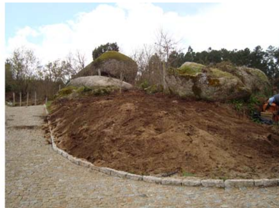
25-03-2013 Regularização e suavização de taludes