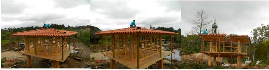
02-04-2013 Finalização da cobertura do elemento construído