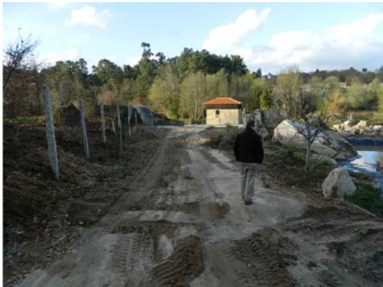
07-03-2013 Continuação da limpeza e despedrega