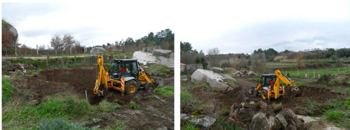
29-01-2013 Limpeza Despedrega e Formalização do Lago Naturalizado

Início de limpeza e despedrega da área correspondente ao lago a naturalizar. Formalização da morfologia do lago. Marcação da localização do alojamento lago.