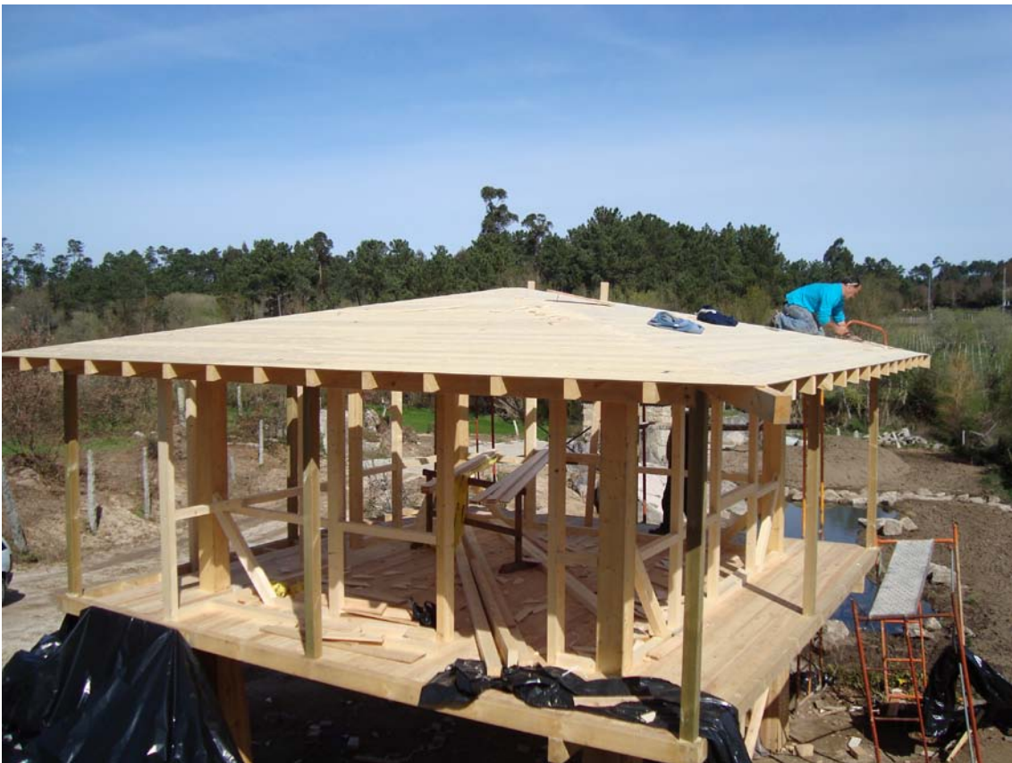
15-03-2013 Evolução dos trabalhos no alojamento lago

Continuação da execução do elemento construído.