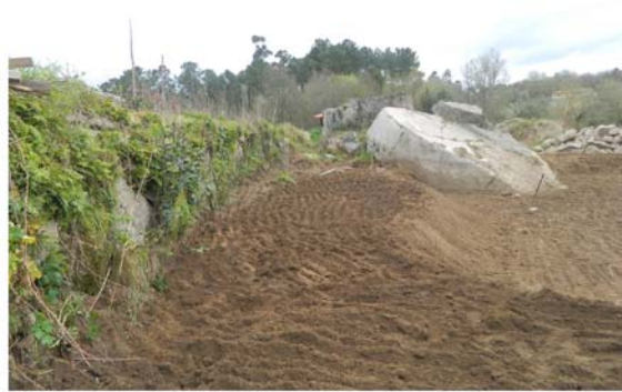
06-03-2013 Continuação da limpeza global do espaço de intervenção