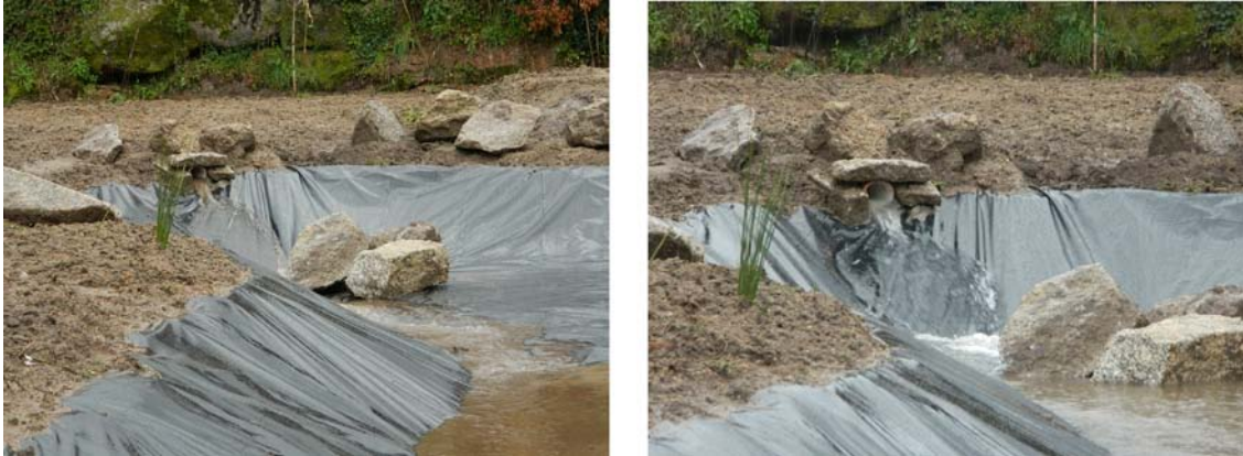
12-03-2013 Pormenor da entrada de água no lago