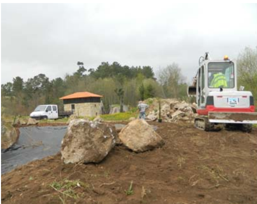
06-03-2013 Colocação de elementos inertes e plantações