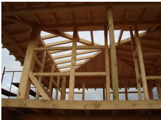
15-03-2013 Evolução dos trabalhos no alojamento lago

Continuação da execução do elemento construído.