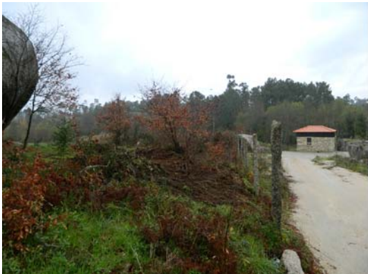
07-03-2013 Continuação da limpeza e despedrega