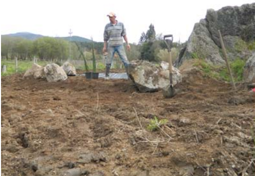
06-03-2013 Colocação de elementos inertes e plantações