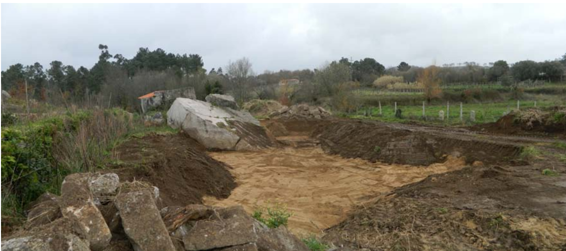
01-02-2013 Evolução da Formalização do Lago Naturalizado