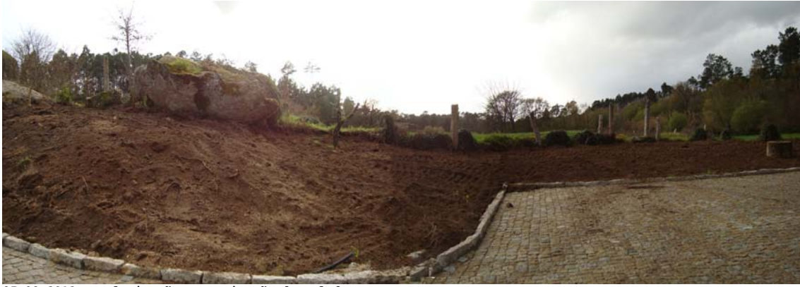
25-03-2013 Regularização e suavização de taludes