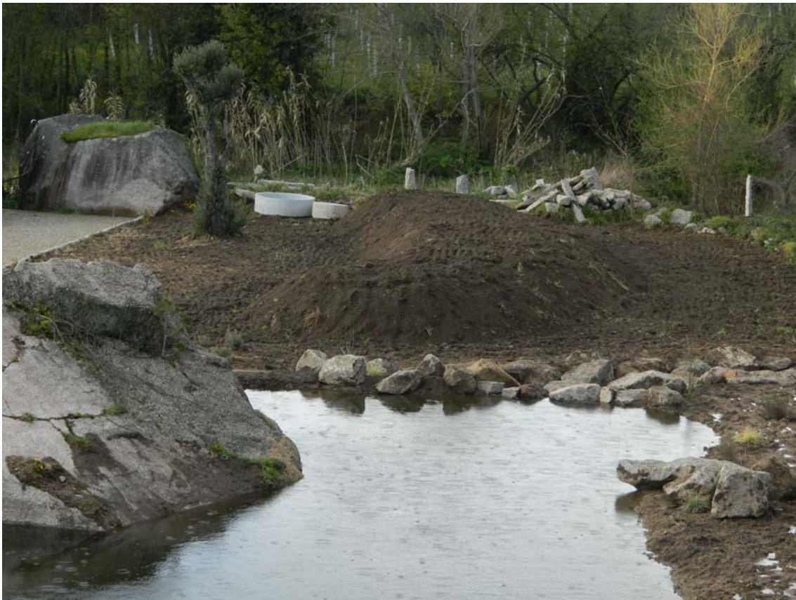
25-03-2013 Vista da janela do Alojamento Lago( em construção) - Pormenor