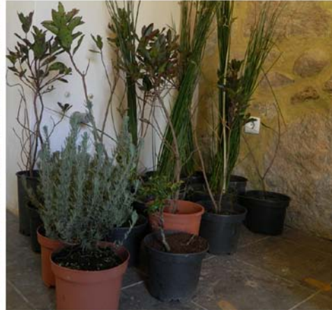
08-02-2013 Plantas autóctones