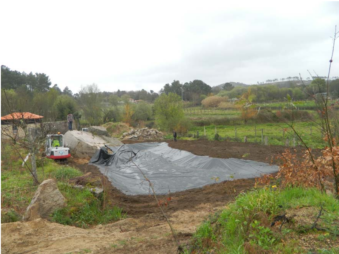
06-03-2013 Colocação da tela impermeabilizante no lago naturalizado