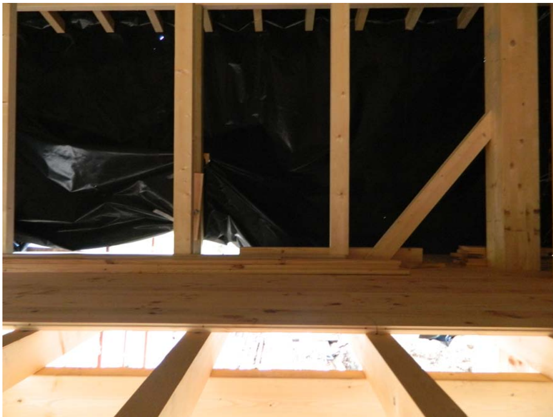
08-03-2013 Continuação da colocação do ripado no elemento construído