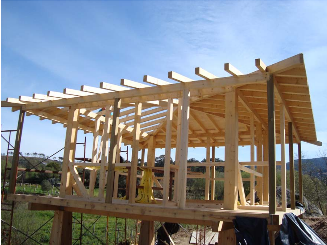
15-03-2013 Evolução dos trabalhos no alojamento lago