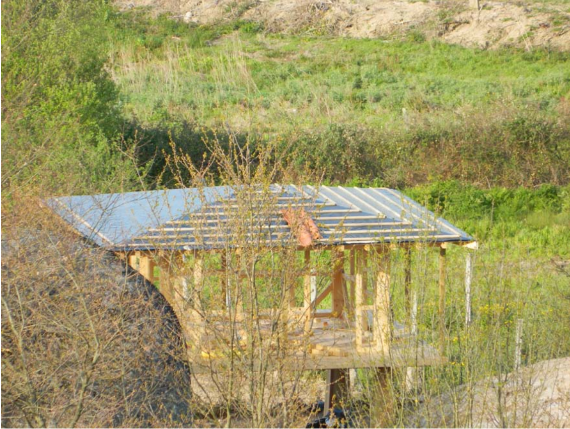
21-03-2013 Continuação do processo de formalização da cobertura, colocação do ripado