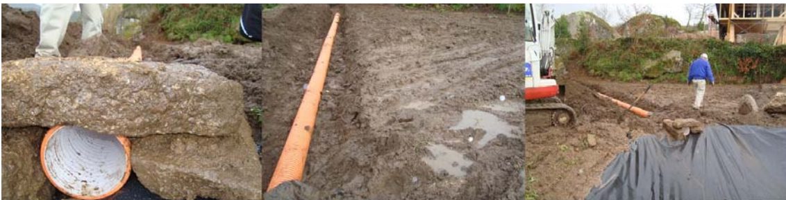
11-03-2013 Entrada de água no elemento e respetiva canalização