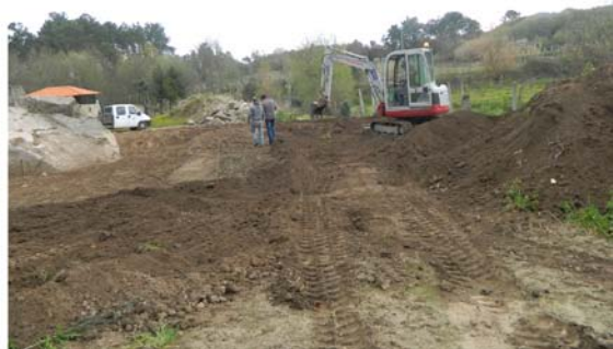
06-03-2013 Continuação da limpeza global do espaço de intervenção