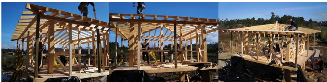
14-03-2013 Evolução dos trabalhos no alojamento lago