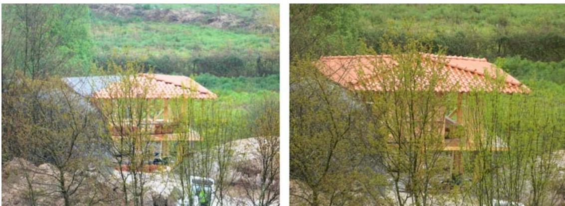
02-04-2013 Finalização da cobertura do elemento construído

Continuação dos trabalhos no elemento construído.