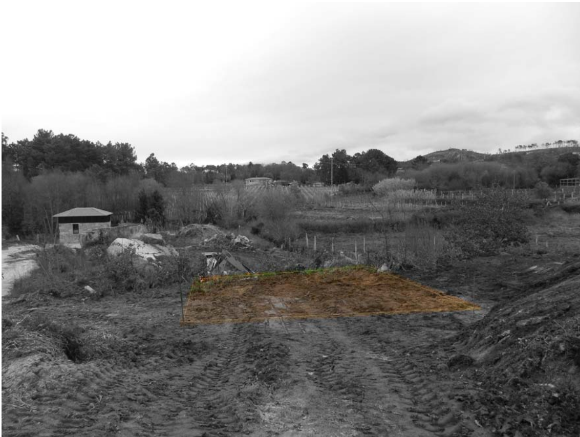
29-01-2013 Início da implantação planimétrica do Alojamento Lago