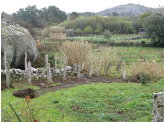
07-03-2013 Continuação da limpeza e despedrega