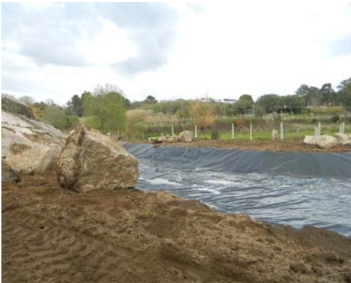
06-03-2013 Colocação de elementos inertes e plantações