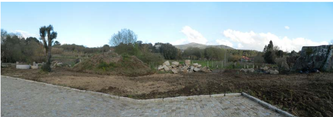
07-03-2013 Continuação da limpeza e despedrega