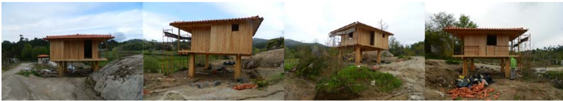
2-04-2013 Continuação da execução do elemento construído