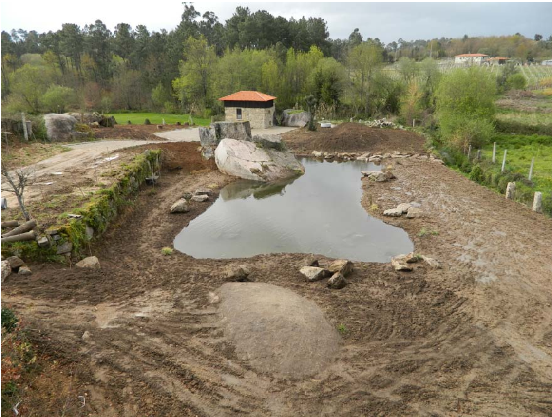
25-03-2013 Vista da janela do Alojamento Lago( em construção)