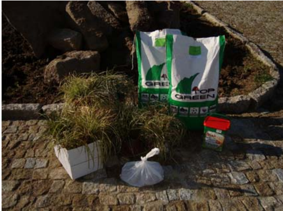
14-03-2013 Pequenas herbáceas e bolbos a plantar

Plantação de pequenas herbáceas e bolbos. Continuação da execução do elemento construído.