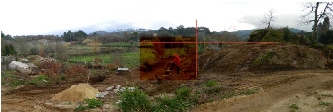
30-01-2013 Pretensão evolutiva da implantação altimétrica do Alojamento Lago - Vista esquemática em corte