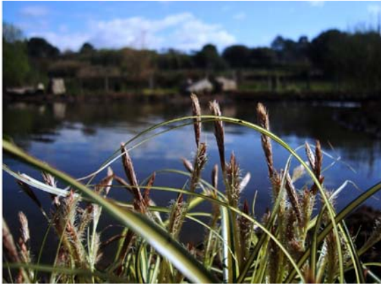
14-03-2013 Plantações de bolbos e plantas autóctones