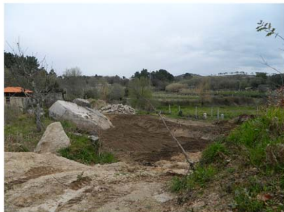
04-03-2013 Evolução da naturalização do lago