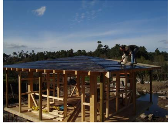
20-03-2013 Evolução dos trabalhos no alojamento lago, impermeabilização da cobertura