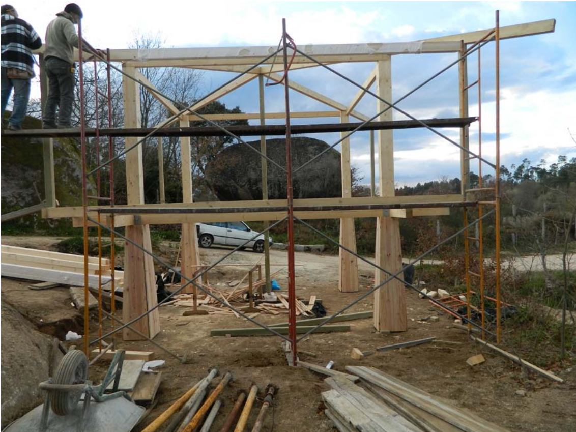
27-02-2013 Evolução da implantação altimétrica do Alojamento Lago