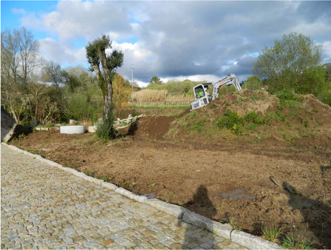
12-03-2013 Início da consolidação da micromodelação a implementar