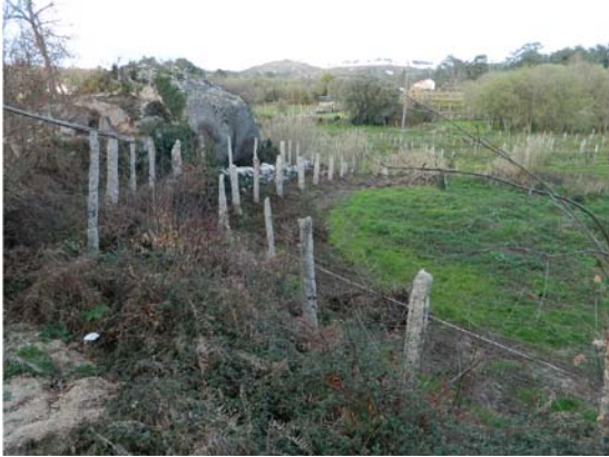
07-03-2013 Continuação da limpeza e despedrega

Continuação da limpeza e despedrega do terreno. Prossecução da implantação do ripado no elemento construído.