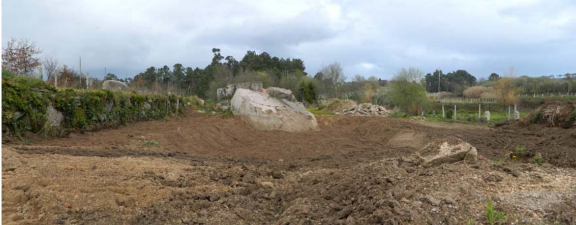
05-03-2013 Evolução da naturalização do lago

Continuação dos trabalhos no elemento construído, início da limpeza e despedrega do terreno envolvente ao lago.