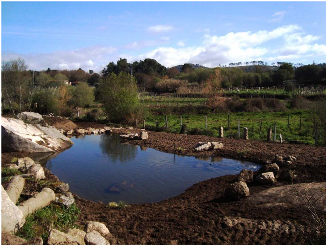
14-03-2013 Vista global do lago naturalizado