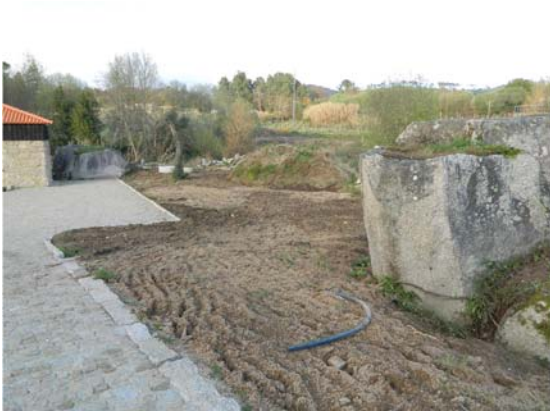
07-03-2013 Continuação da limpeza e despedrega