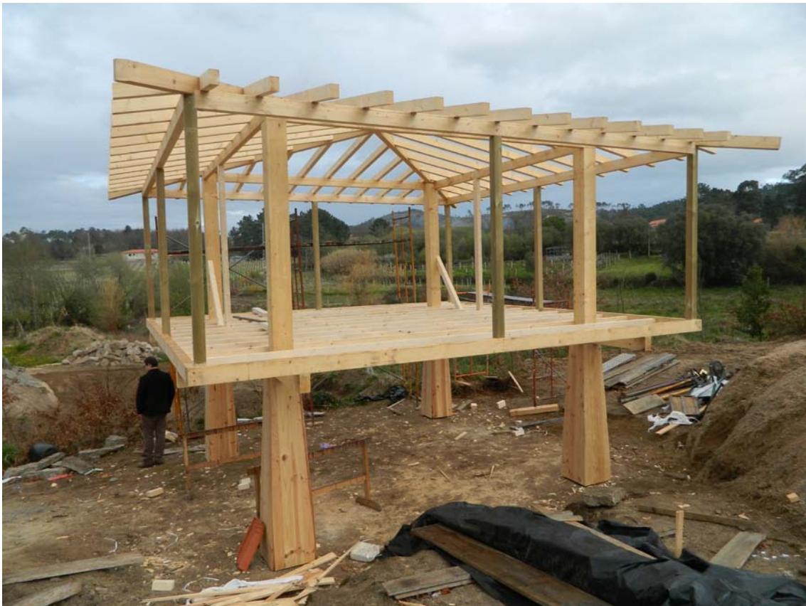
5-03-2013 Evolução da implantação altimétrica do Alojamento Lago