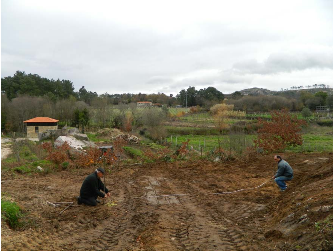
29-01-2013 Início da implantação planimétrica do Alojamento Lago