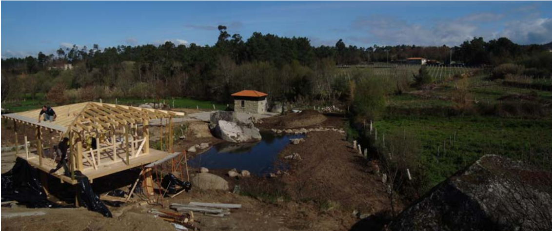
14-03-2013 Evolução dos trabalhos no alojamento lago

FASE E - continuação dos trabalhos de construção - Alojamento Lago