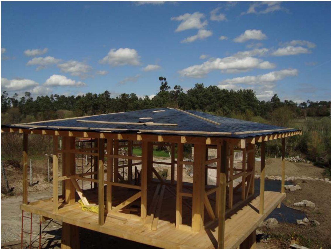
21-03-2013 Continuação do processo de impermeabilização da cobertura, colocação da tela

Continuação da execução do elemento construído.