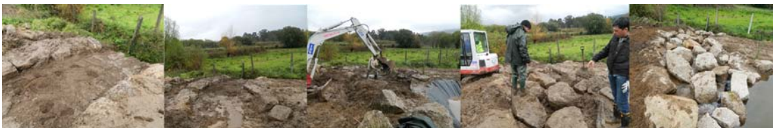
12-03-2013 Evolução da saída de água do lago naturalizado