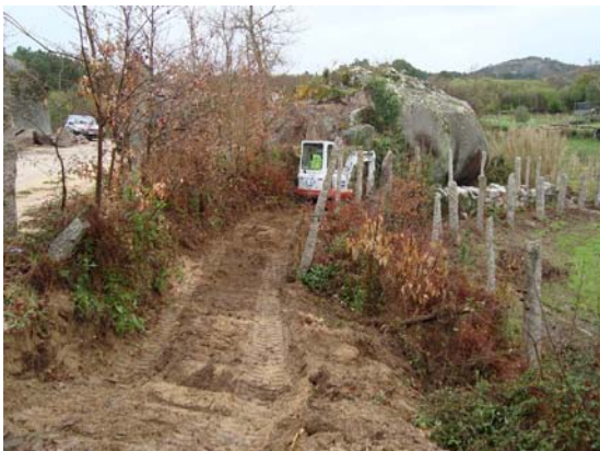
11-03-2013 Continuação da limpeza e despedrega