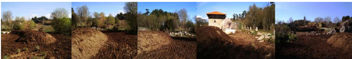
13-03-2013 Construção da micromodelação