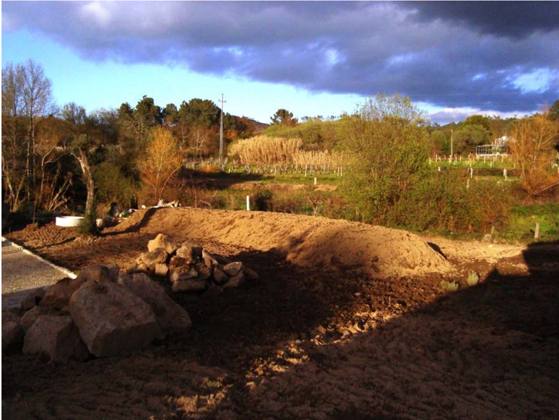
13-03-2013 Construção da micromodelação

Concretização da micromodelação. Ajustes de cotas do terreno.