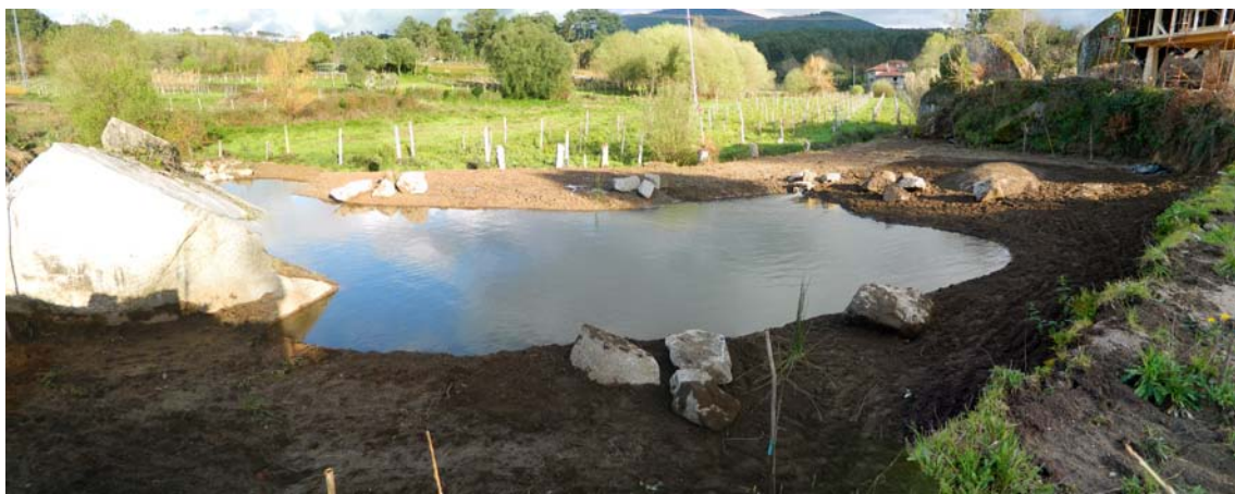
12-03-2013 Panorâmica do lago naturalizado