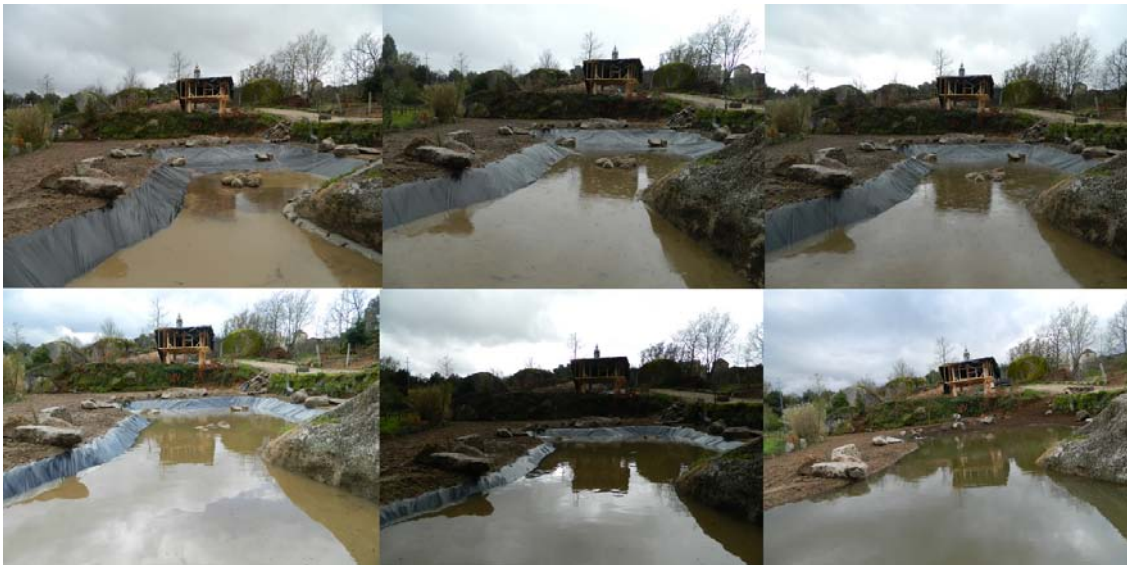
12-03-2013 Evolução da entrada de água