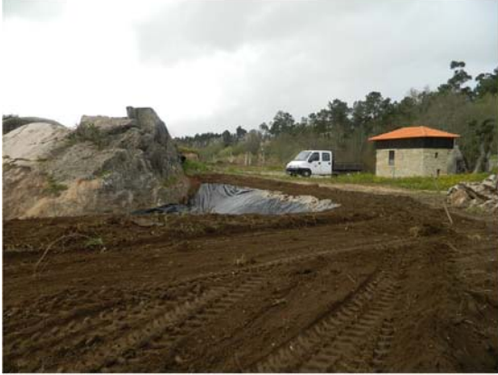
06-03-2013 Colocação da tela impermeabilizante no lago naturalizado