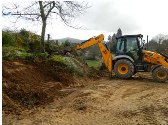
28-01-2013 Início de Limpeza e Despedrega - Local de implantação de Alojamento Lago