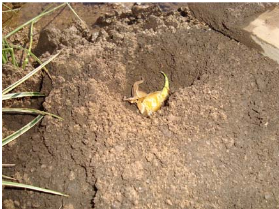
14-03-2013 Plantações de bolbos e plantas autóctones