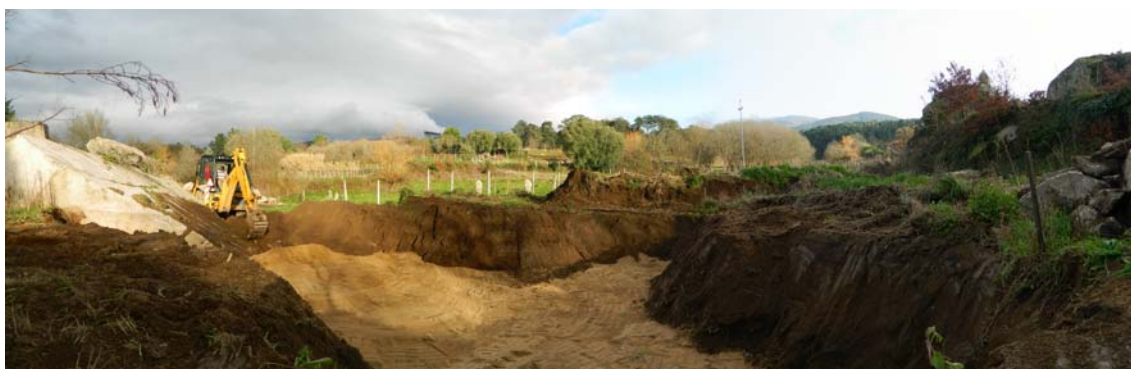
29-01-2013 Limpeza Despedrega e Formalização do Lago Naturalizado