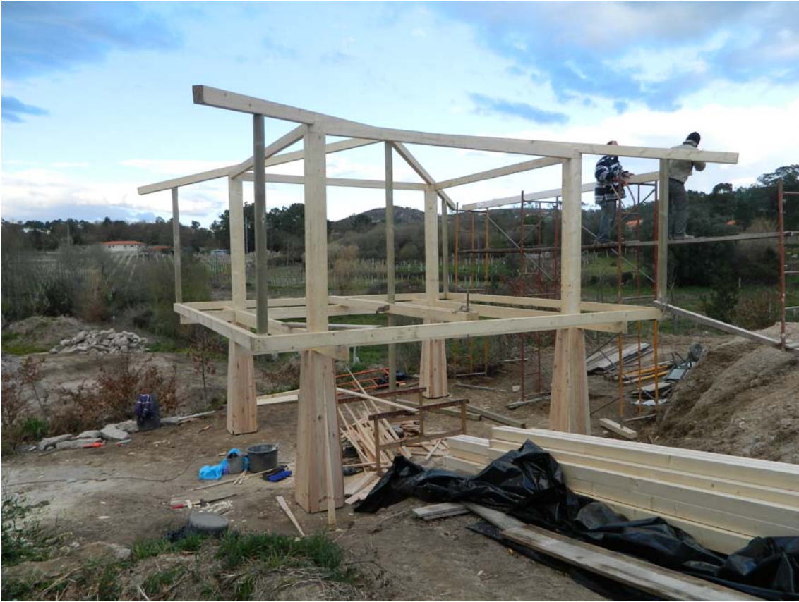
27-02-2013 Evolução da implantação altimétrica do Alojamento Lago