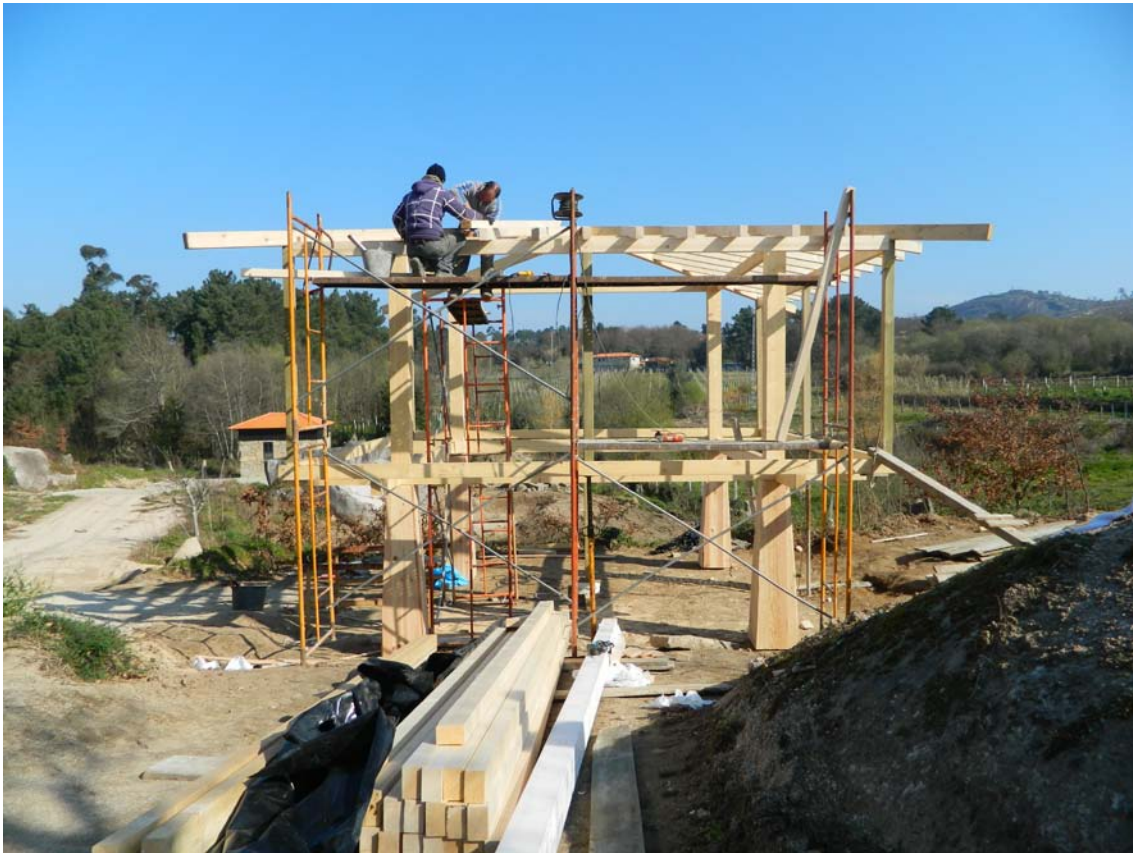
01-03-2013 Evolução da implantação altimétrica do Alojamento Lago

Continuação da construção do alojamento lago sendo que no momento a evolução se concentra na zona da cobertura e finalização da esquadria global do elemento.