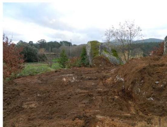
28-01-2013 Início de Limpeza e Despedrega - Local de implantação de Alojamento Lago