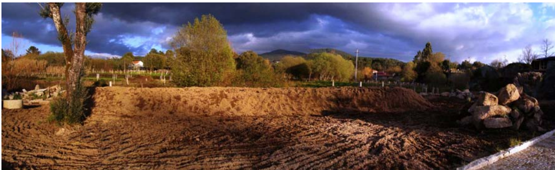
13-03-2013 Construção da micromodelação