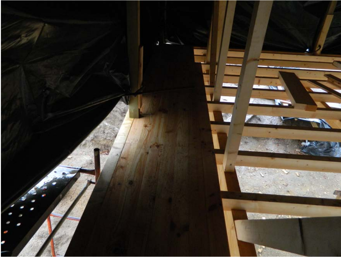
07-03-2013 Início do assentamento do ripado da base no alojamento lago