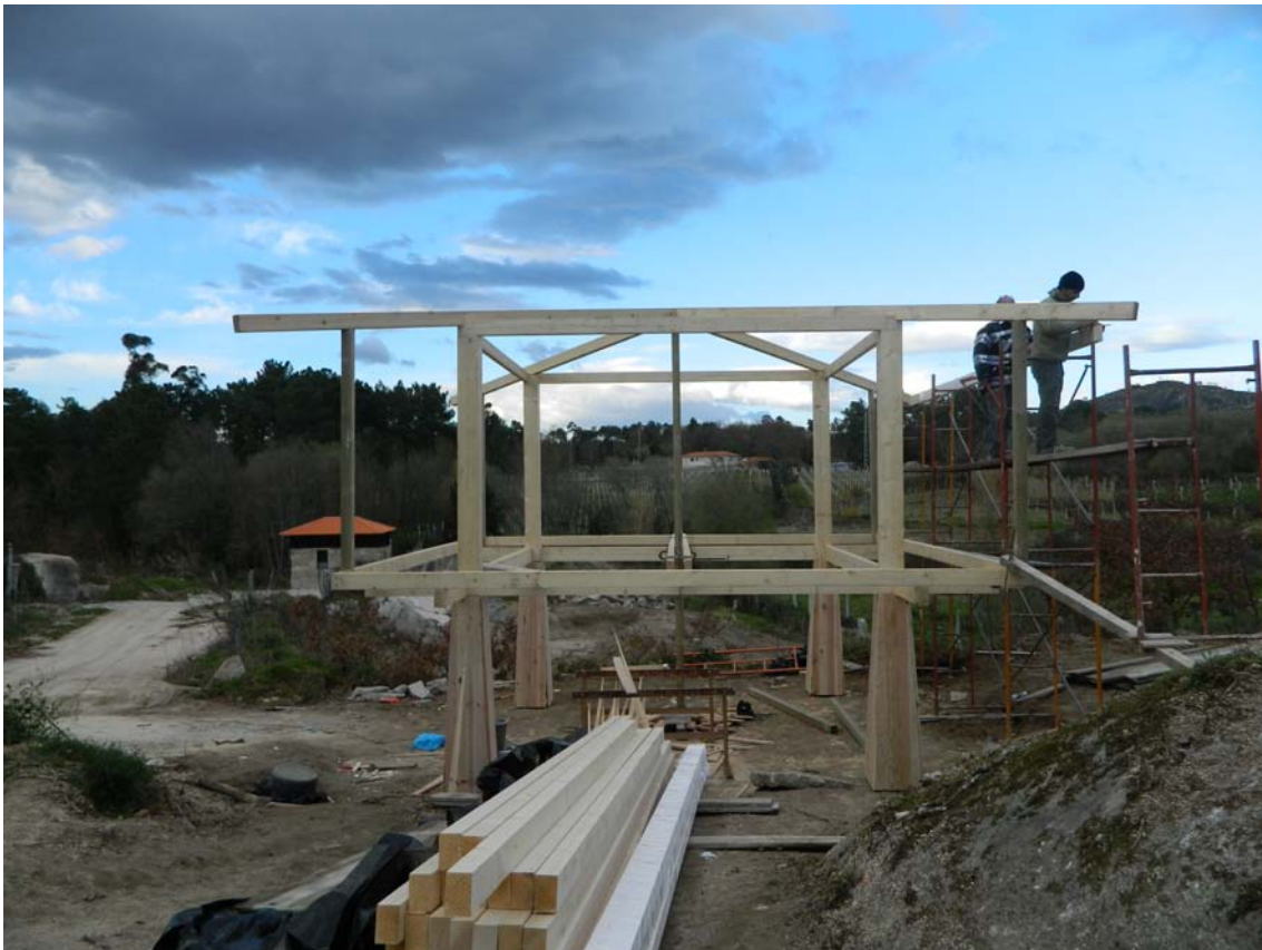
27-02-2013 Evolução da implantação altimétrica do Alojamento Lago

Continuação da construção do Alojamento Lago.