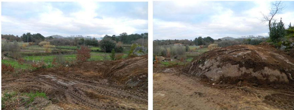
28-01-2013 Início de Limpeza e Despedrega - Local de implantação de Alojamento Lago