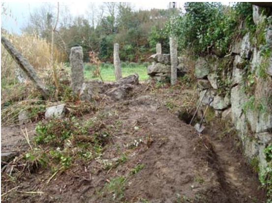
11-03-2013 limpeza e consolidação do canal de passagem de água