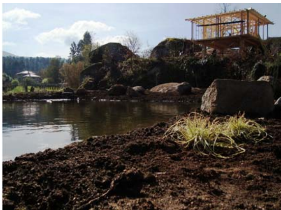
14-03-2013 Plantações de bolbos e plantas autóctones