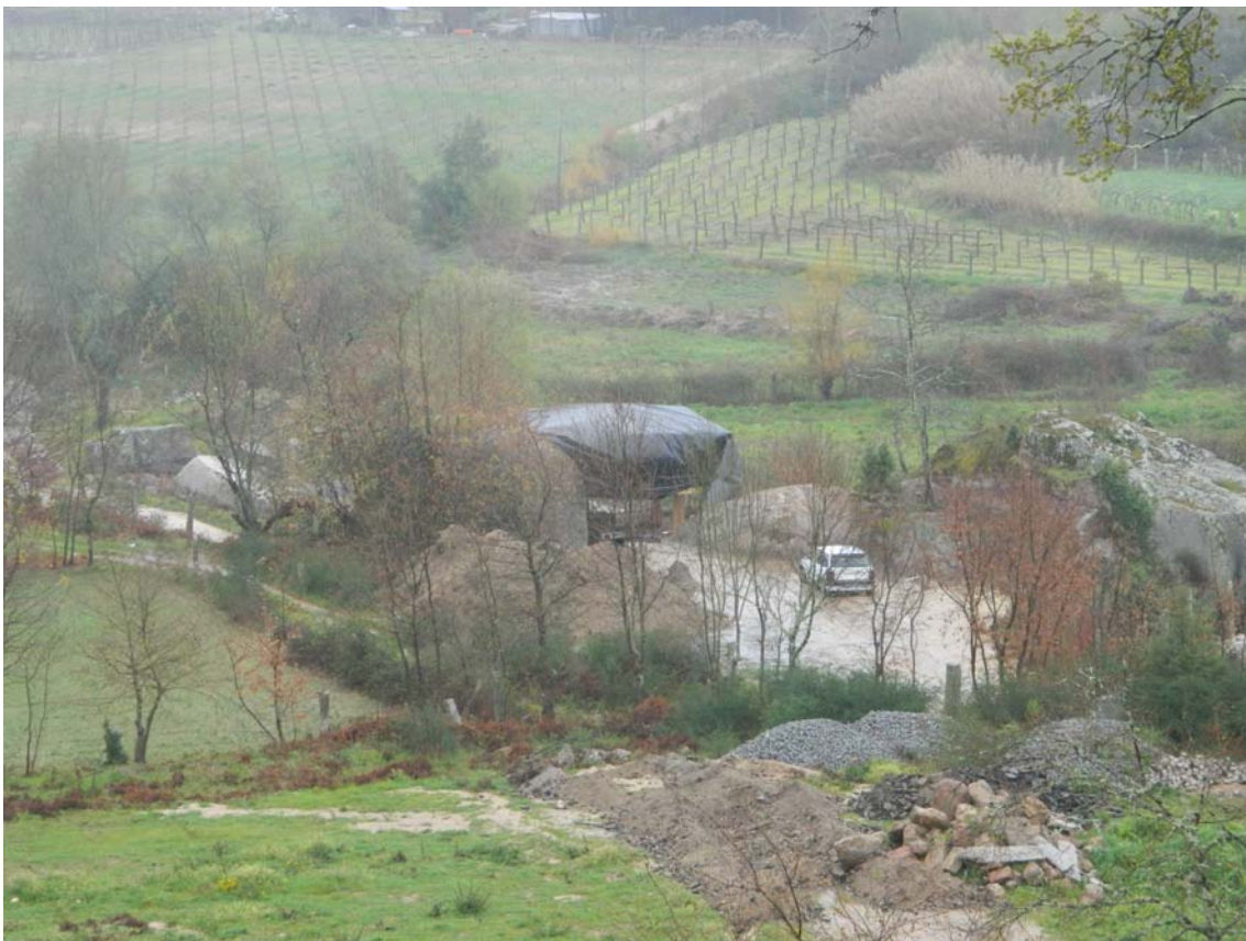
07-03-2013 Proteção do elemento construído

Proteção do elemento construído com uma superfície impermeável de forma a prosseguir com os trabalhos(dadas as condições climáticas desfavoráveis).