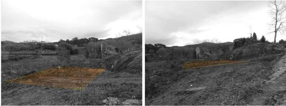
29-01-2013 Início da implantação planimétrica do Alojamento Lago

FASE C - Início dos trabalhos de construção