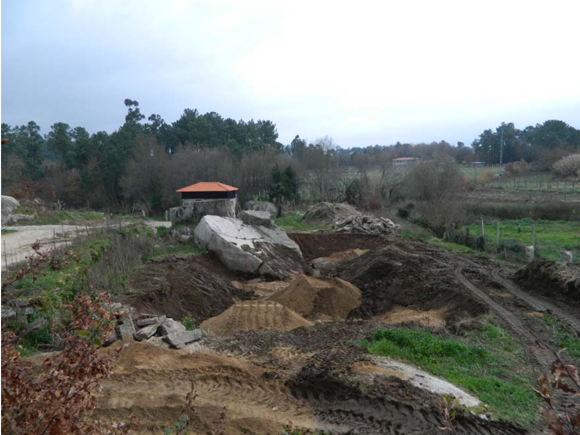
30-01-2013 Evolução da Formalização do Lago Naturalizado