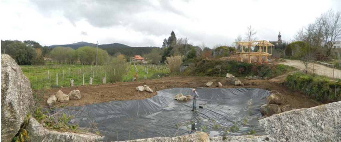
06-03-2013 Colocação de elementos inertes e plantações