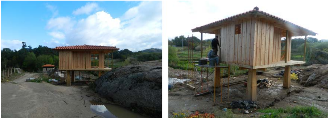
2-04-2013 Continuação da execução do elemento construído