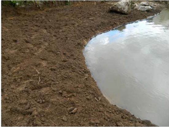
12-03-2013 Remates do espelho de água