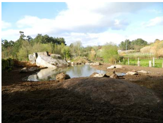
12-03-2013 Vistas globais do elemento de água