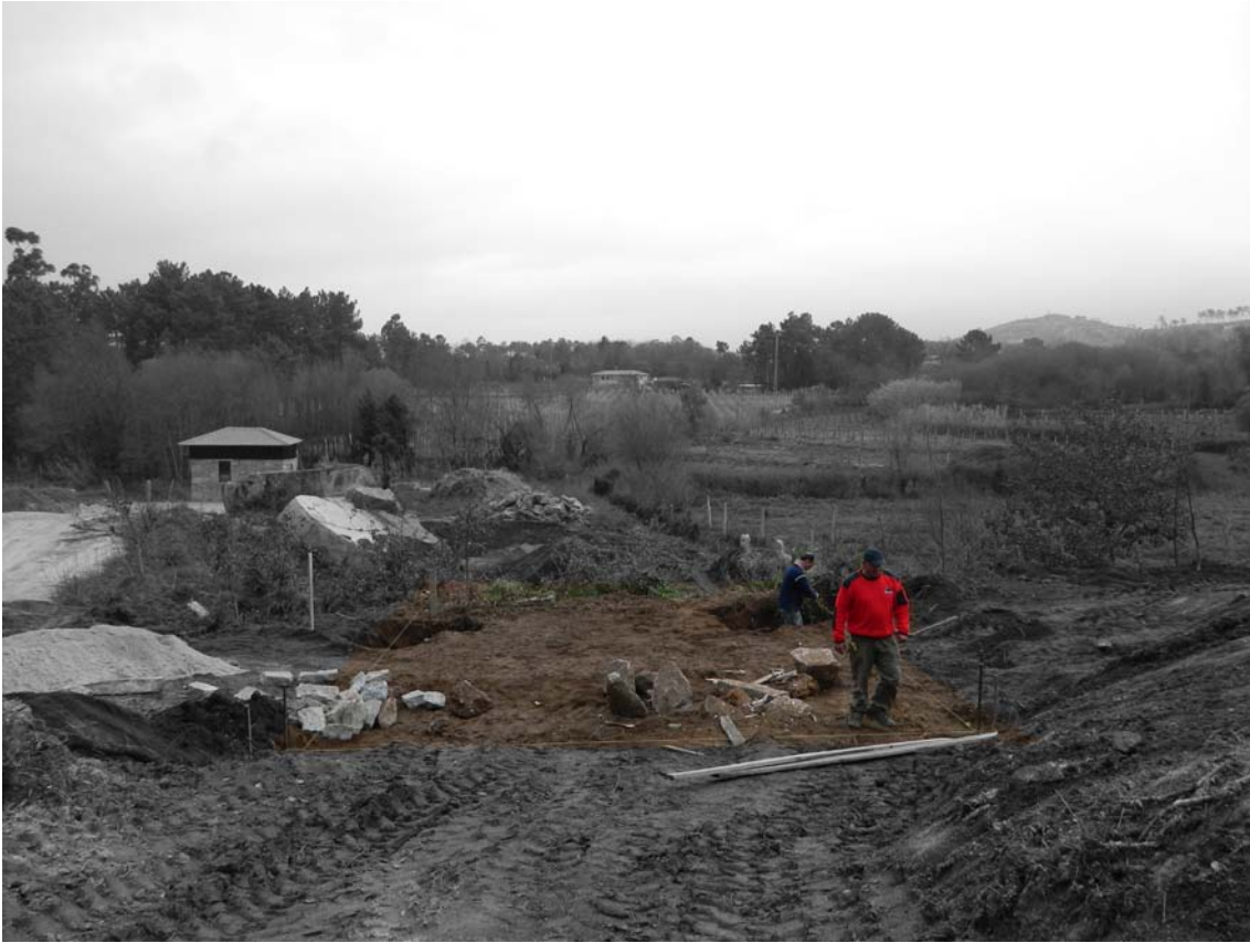
30-01-2013 Evolução da implantação planimétrica do Alojamento Lago