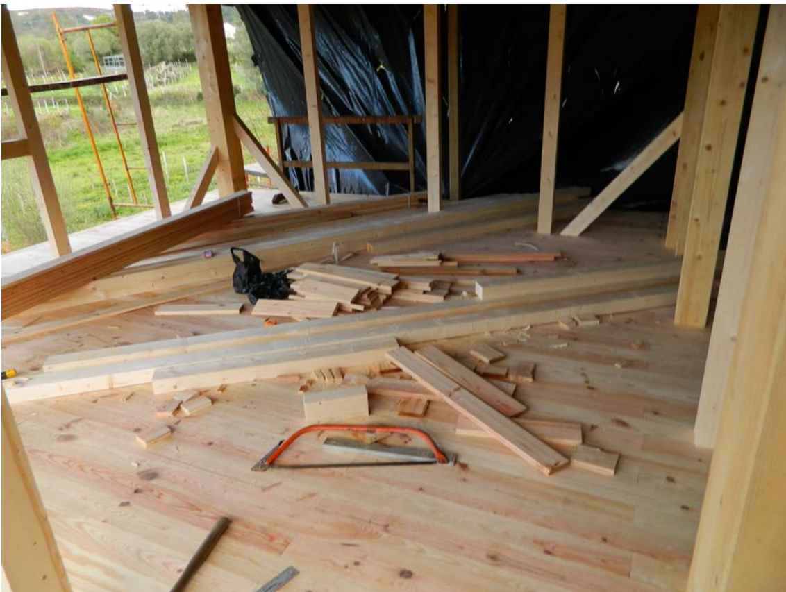
12-03-2013 Continuação dos trabalhos no elemento construído