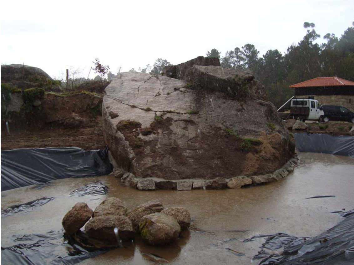
11-03-2013 Detalhe de colocação da tela junto ao afloramento rochoso