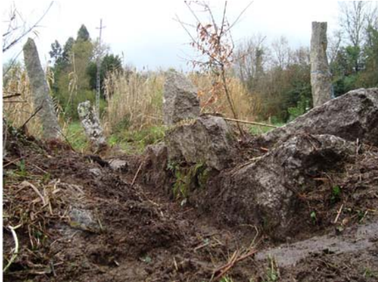
11-03-2013 Redirecionamento da água da ribeira adjacente

Remates e consolidação final da estrutura do lago. Abertura e canalização da passagem de água para o espelho de água. Continuação da limpeza e despedrega global.