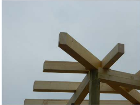
04-03-2013 Evolução da implantação altimétrica do Alojamento Lago