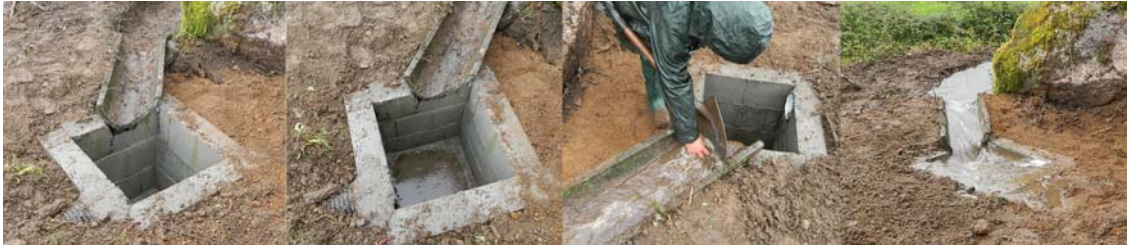
2-03-2013 Filtro por gravidade para retenção de impurezas