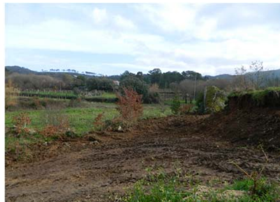
28-01-2013 Início de Limpeza e Despedrega - Local de implantação de Alojamento Lago